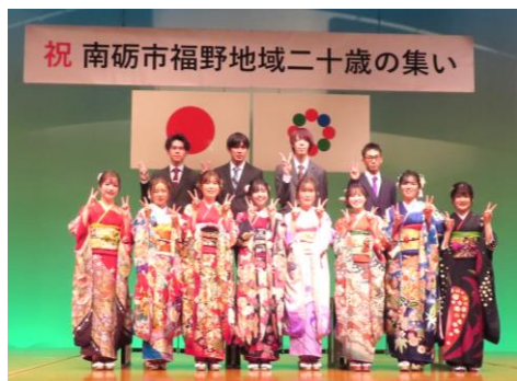
祝 南砺市福野地域二十歳の集い

福野文化創造センターヘリオスにて、成人式に代わる「二十歳の集い」が開催されました。式典の名称は変更されましたが、会場は旧友や恩師との再会を喜ぶ笑顔であふれ、以前と変わらぬ光景が見られました。