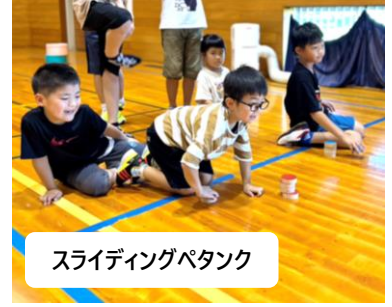
スライディングペタンク