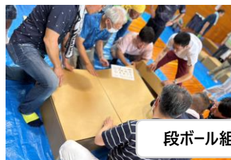
段ボール組み立て訓練