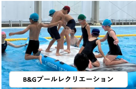
B&Gプールレクリエーション