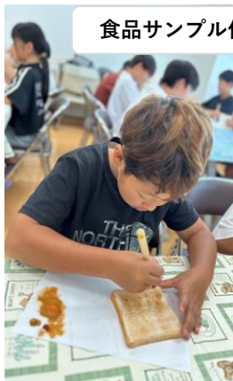
食品サンプル作り