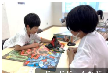
ボードゲームなど

また、食事が出来上がるまではドミノやボードゲーム、体育館ではバドミントン、ピクセルボールなど、さまざまな遊びを楽しむ姿が見られました。